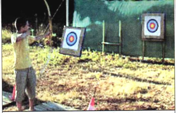
Un stand de tir à l'arc est installé sur la base de la Pierre-Plantade.