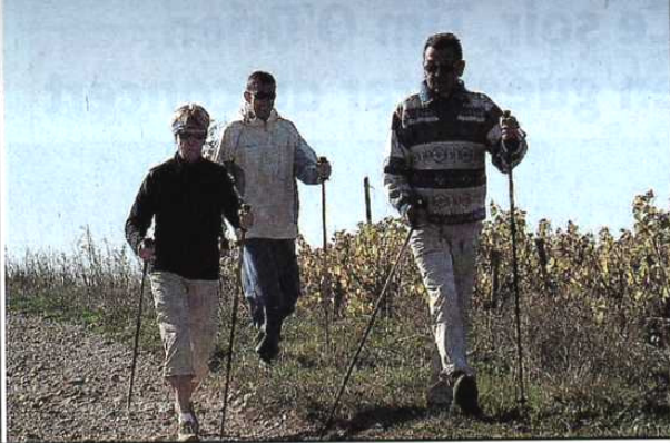
Le Nordic walking, conseillé pour les seniors et ceux qui veulent maigrir.